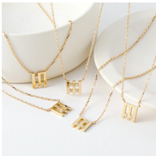
Diamond Necklace in 18K Yellow Gold