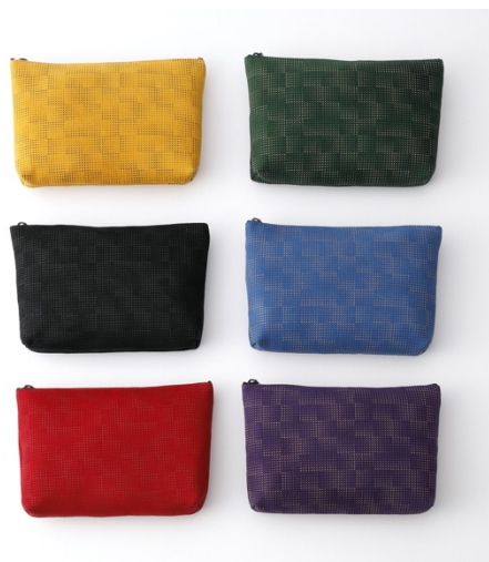
Inden Pouch Bag with Gradient Pattern